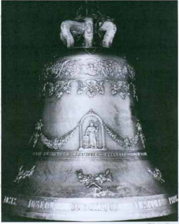
1958 La campana della Chiesa di San Giuseppe, realizzata dalle fonderie De Poli su iniziativa del Circolo ACLI

Da subito avemmo la fortuna e la voglia di lavorare per il benessere del quartiere instaurando un rapporto di amicizia e collaborazione con la nostra parrocchia: un rapporto semplice ma costruito su fondamenta di pietra che dura ancora oggi e che ci ha visto realizzare assieme attività importanti e utili per la comunità. Molte delle nostre sedi furono infatti gestite o fornite in uso dai parroci che si sono succeduti, sensibili nel capire i bisogni dell'associazione e riconoscenti per l'opera di volontariato che fin dai nostri esordi abbiamo perseguito con tenacia. Ricordiamo in quest'occasione di festa per il compimento dei nostri 60 anni la realizzazione della campana della Chiesa del S. Giuseppe operaio, forgiata dalla Fonderia De Poli di Vittorio Veneto e realizzata su iniziativa del nostro Circolo. Intanto cambiava il mondo e gli anni '60 e '70 furono periodi di intensa attività sociale e politica, ai quali non ci sottraemmo, anzi! Non si contano in questi decenni le serate di approfondimento sui temi del lavoro e del diritto alla pensione e alla sindacalizzazione degli operai, i corsi professionalizzanti pensati per le donne e i ragazzi, le analisi attente del momento storico che stavamo vivendo, sfociati nella partecipazione alla vita della comunità e alla volontà di contribuire a disegnarne lo sviluppo e il benessere.