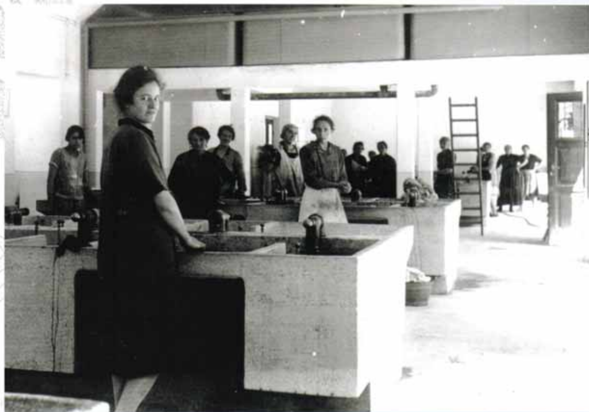
Momenti nella lavanderia del quartiere negli anni '50 e '60