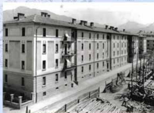
Case nuove e case in costruzione in via Filzi

15 dicembre 1953 Prime iniziative del Circolo di S. Giuseppe