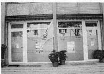
Il circolo Acli ora è più accessibile