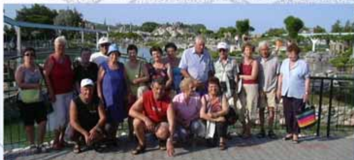
2006 Un riposante soggiorno al mare per i soci del circolo!